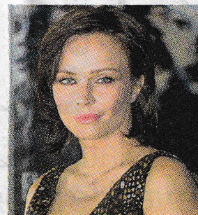
L'ATRICE Francesca Neri

«Si è allungata la vita, e anche il piacere. Per me che ho 53 anni oggi il sesso è più importante di prima. È condivisione. Hai un'esperienza e una libertà mentale che ti permettono di goderne appieno. Sei più libera anche dal punto di vista della carriera e i fi-