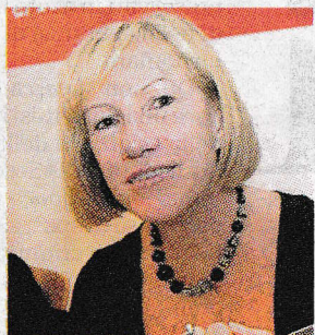
LA SCRITTRICE Lidia Ravera

«Questa è una lotta che interessa anche le ragazze: volete essere definite soggetti non più desiderati e non più desideranti? Il diritto a provare piacere deve essere preservato sempre, motivo per cui è bene non abbassare mai la guardia. Siamo stati abituati all'idea che il corpo dell'uomo non ha scadenze. Non ne ha neanche la donna».