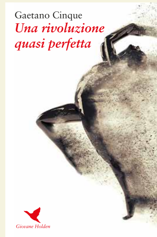
Una rivoluzione quasi perfetta pubblicato nel giugno 2017 da Giovane Holden Edizioni di Viareggio

È possibile vivere nello stesso tempo più vite senza che tra loro ci sia alcuna interferenza? Fatta una scelta tra le tante che si presentano nella vita, quelle escluse sono definitivamente perse o è possibile un loro recupero? È ciò che si chiede ossessivamente Paolo S., il protagonista di questo romanzo, che oscilla tra presente e passato per la definizione di un futuro, che appare sempre più incontrollabile.