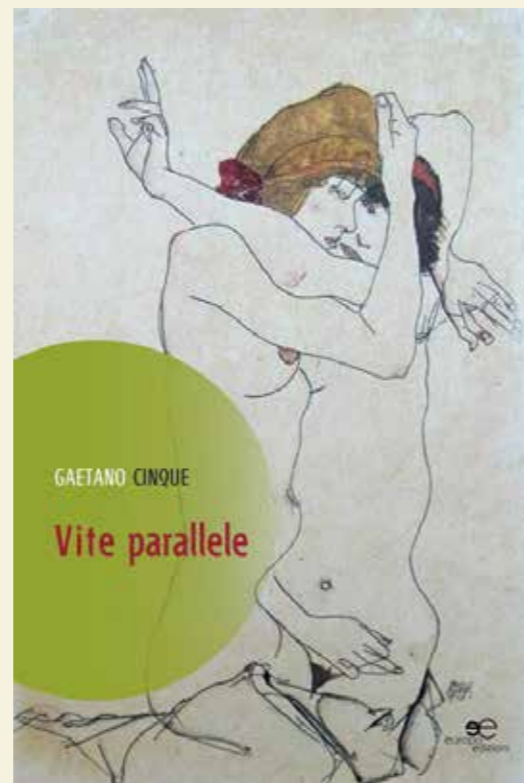
Vite parallele pubblicato nell'agosto 2016 da Europa Edizioni di Roma

Per decenni dimenticati chiusi in un cassetto e inopinatamente ritrovati, gli scritti giovanili sono materia incandescente, sorprendente per il loro stesso autore. In essi c'è quella sensazione di avere a che fare con qualcosa di pericoloso, di proibito: Manoscritti scandalosi, appunto, un archivio della propria adolescenza, di un sé che si stenta a riconoscere, e che riporta in vita un mondo intero, insaporito dai decenni e dall'odore di chiuso.